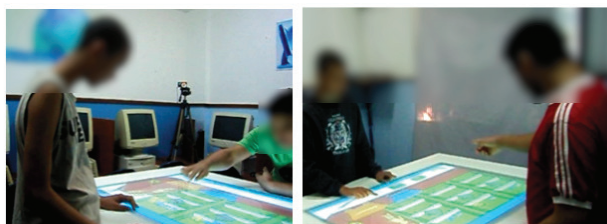
Figura 2. Exemplo de manifestações de interação dos usuários: falar e apontar.

Os resultados mostram que à medida que os participantes avançaram no jogo, eles iam conseguindo mais motivação para colaborar usando diversas manifestações interativas que foram aumentando em cada fase. Assim, olhar, falar, pedir ajuda, reclamar, comemorar, sorrir, apontar, executar e ter contato físico, ocorreram nas três fases do jogo; rir, rejeitar e agradecer, ocorreram nas fases 2 e 3, e perguntar, ocorreu já na fase 3. Destaca-se que as SIN e IIN foram cada vez maiores no número ações e respostas de um para outro em cada fase do jogo, atribuindo isto às tarefas próprias de cada dimensão de colaboração, que exigiram cada vez maior colaboração durante a interação e, por conseguinte, maior necessidade de solicitar e oferecer ajuda entre os participantes (ver figura 6.5 no documento completo da dissertação [Silva 2012]). Com isto, pode-se observar que as dimensões de